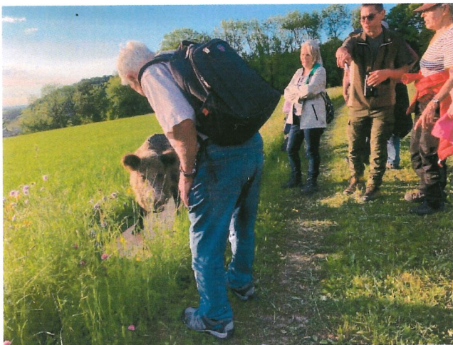
Wildtiere im Dorf, Wald und Feld mit Jagdgesellschaft