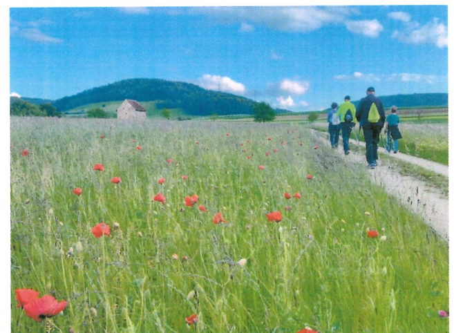
Nordic Walking mit physiobuus