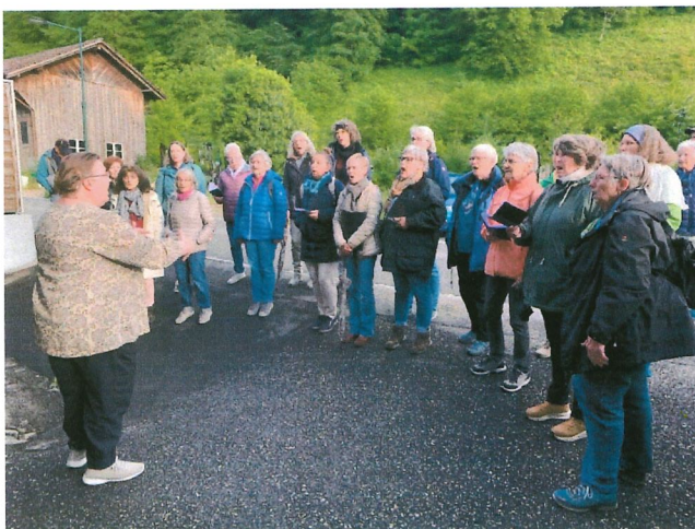
Spaziergang und Singen unterwegs mit Frauenchor Buus