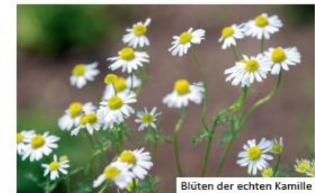
Blüten der echten Kamille

gebietsfremdes Kanadisches Berufkraut ( Erigeron canadensis ) oder heimisches Scharfes Berufkraut ( Erigeron acris ): beide haben jedoch kürzere Blütenblätter verschiedene Kamillen (Hundskamillen, Echte Kamille, Strandkamille): breite und weniger zahlreiche Blütenblätter sowie geteilte Blätter